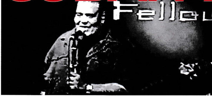
←El Indio Anga ファンミゲルディアス サヤス (Vo.)

キューバの至宝級歌手。キューバを代表する名門ティンパグループ オルケスタ・レベに在籍、1996年にソロリストとしてスペインに渡る。同年、兄(コンガ奏者)ミゲルアウレリオディアス サヤスのアルバム「ミゲルアンガディアス」にてグラミー賞を受賞。