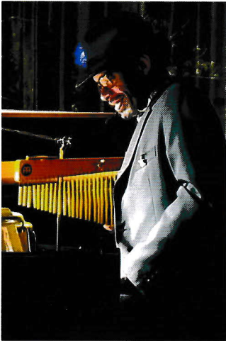
←Ludwig Nurmes ルドウィッグ (Per.)

モントルージャズフェスティバルをはじめ世界中の音楽祭に参加する等、キューバ音楽への貢献は計り知れない。