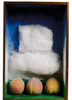
1 《ココ・シャネル》1935年 ゼラチン・シルバー・プリント(後刷) 個人蔵 2 《宮脇愛子の肖像》1962年 ゼラチン・シルバー・プリント(レプリカ) 宮脇愛子アトリエ蔵 3 《永続するモチーフ》1923/1971年 木製メトロノーム、目の写真 個人蔵 4 《手(レイオグラフ)》1927年 ゼラチン・シルバー・プリント(後刷) 個人蔵 5 《ベシャージュ(桃・雲・風景)》1969/1972年 木製箱、人工の桃3個、綿、塗料 個人蔵 1.3.4.5: Courtesy Association Internationale Man Ray, Paris (3&5: Photo Marc Domage) 2: Courtesy Aiko Miyawaki Atelier ©MAN RAY 2015 TRUST/ ADAGP, Paris & JASPAR, Tokyo, 2021 G2698